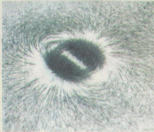
Ystervysels vorm 'n interessante patroon.